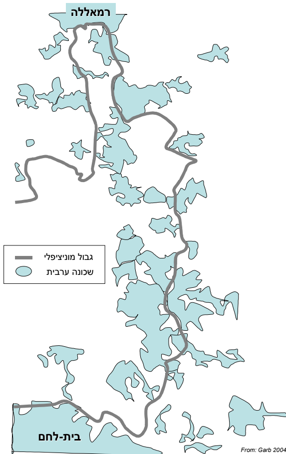
מפה מס' 2: האזור העירוני הערבי, המאוחד מבחינה תפקודית, 1968-1991.

עם זאת, במקביל, המשיכה ירושלים המזרחית לתפקד כאזור עירוני מאוחד למדי, עבור האוכלוסייה הערבית שלה גם לאחר כיבוש הגדה המערבית ב-1967, ולאחר סיפוח השכונות המזרחיות של העיר לירושלים ב-1981. התעסוקה, חיי החברה, חיי הדת והחלטות לגבי מיקום מגורים התרחשו כולם באזור מאוחד מבחינה תפקודית ומרחבית, שהקיף את השכונות הערביות שסופחו לתחום המוניציפלי של ירושלים ואת האזורים הפלסטיניים שמחוץ לתחום זה.