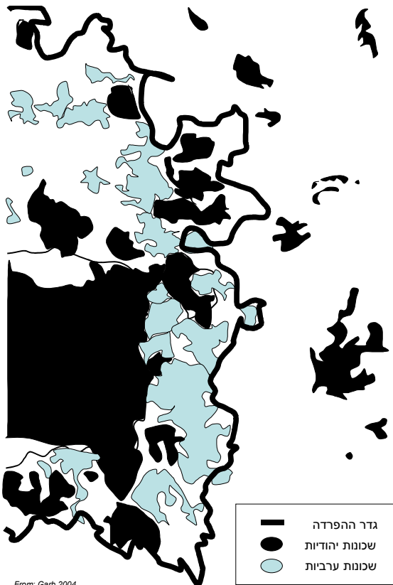
מפה מס' 3: שכונות ערביות בירושלים, בתוך תחומי גדר ההפרדה

השכונות הערביות שיוותרו בתוך תחומי הגדר אינן משתייכות באופן מלא לעיר ירושלים וכעת גם ינותקו מן העורף הערבי הרחב יותר שמחוץ לתחום המוניציפלי, המספק את המסה הקריטית של פעילויות והזדמנויות המאפיינות חיים אורבניים: חנויות, לקוחות, בני זוג פוטנציאליים, חברים ומשפחה - כל אלה יוותרו כעת מעברה השני של הגדר. אם יימשכו המגמות הנוכחיות, עתידות שכונות פנימיות אלו להפוך לסדרת כפרים מנותקים, פזורים מול חומה מקיפה ומקושרים לירושלים המערבית בקשרי תעסוקה בלבד.